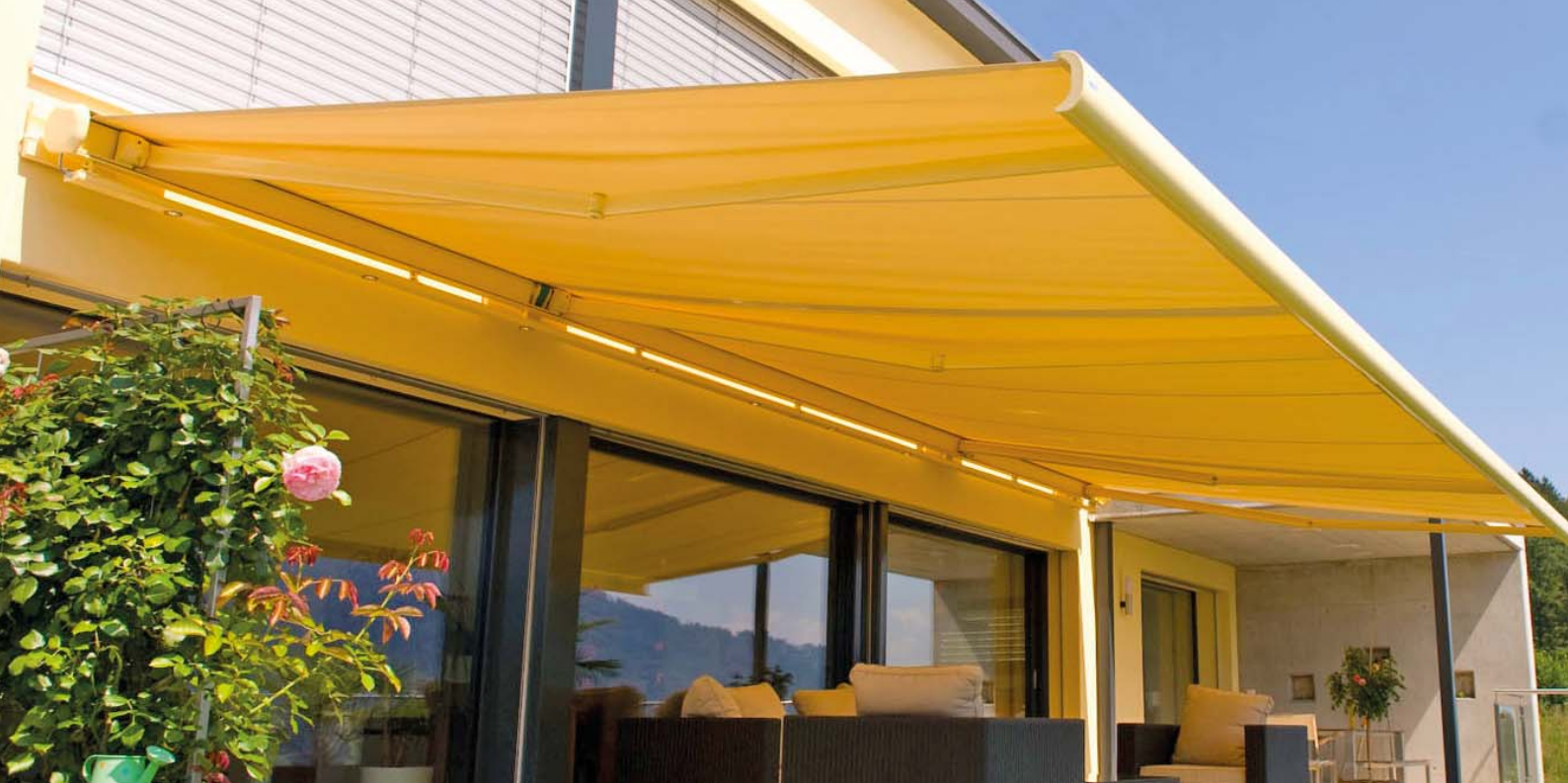
Schwerlastkonsole SLK®-ALU-TR / -TQ