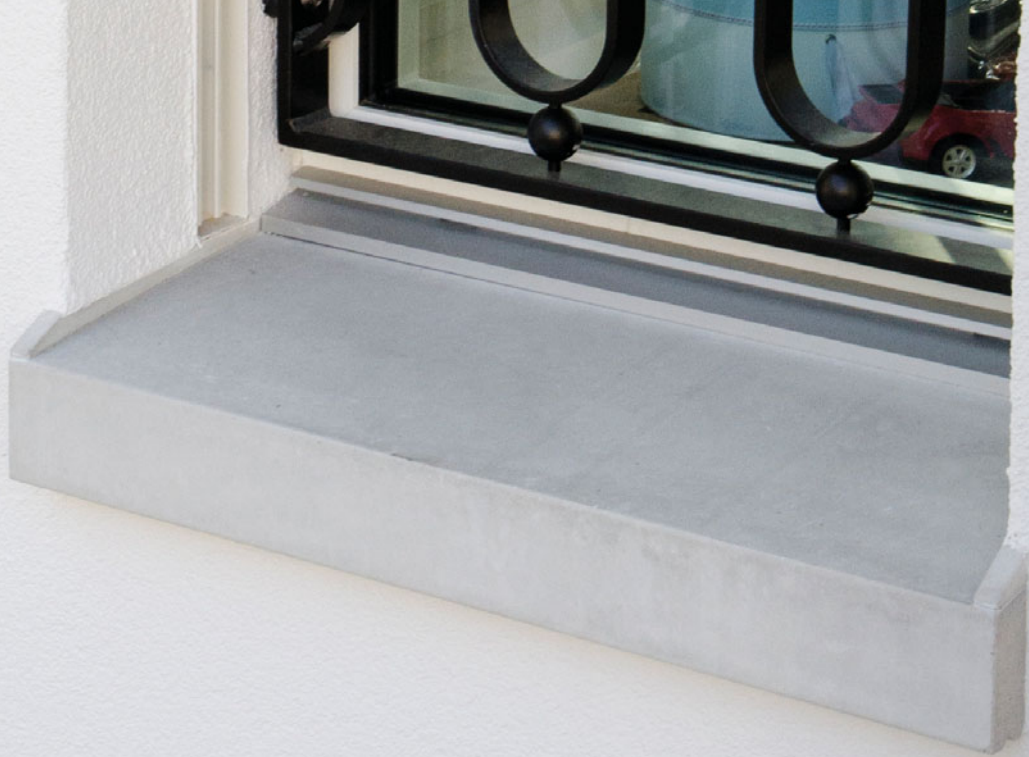
Tablettes de fenêtre en fibrobéton