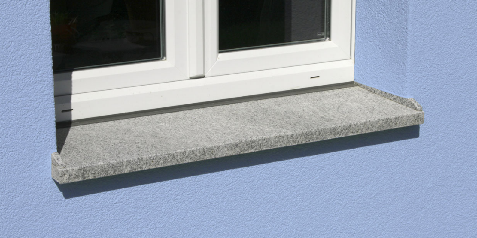
Fensterbänke aus Granit